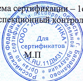
Схема сертификации – 1с(м). Инспекционный контроль – апрель 2023 года, апрель 2024 года.